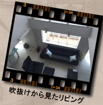
吹抜けから見たリビング