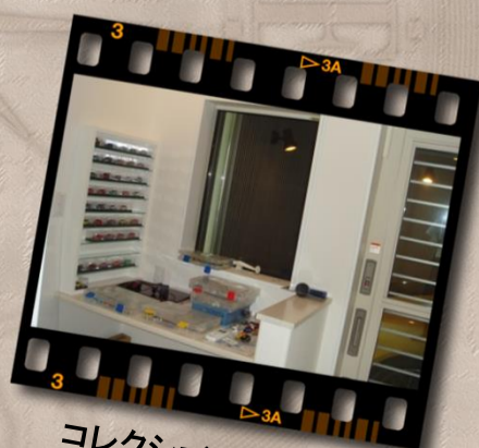
コレクションルーム