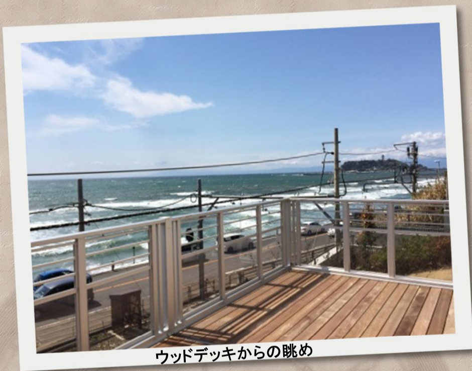
ウッドデッキからの眺め