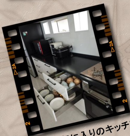
奥様お気に入りのキッチン