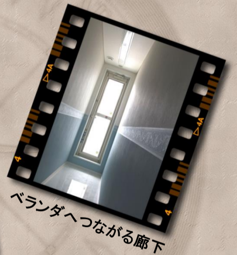
ベランダへつながる廊下