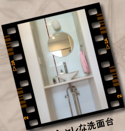
オシャレな洗面台