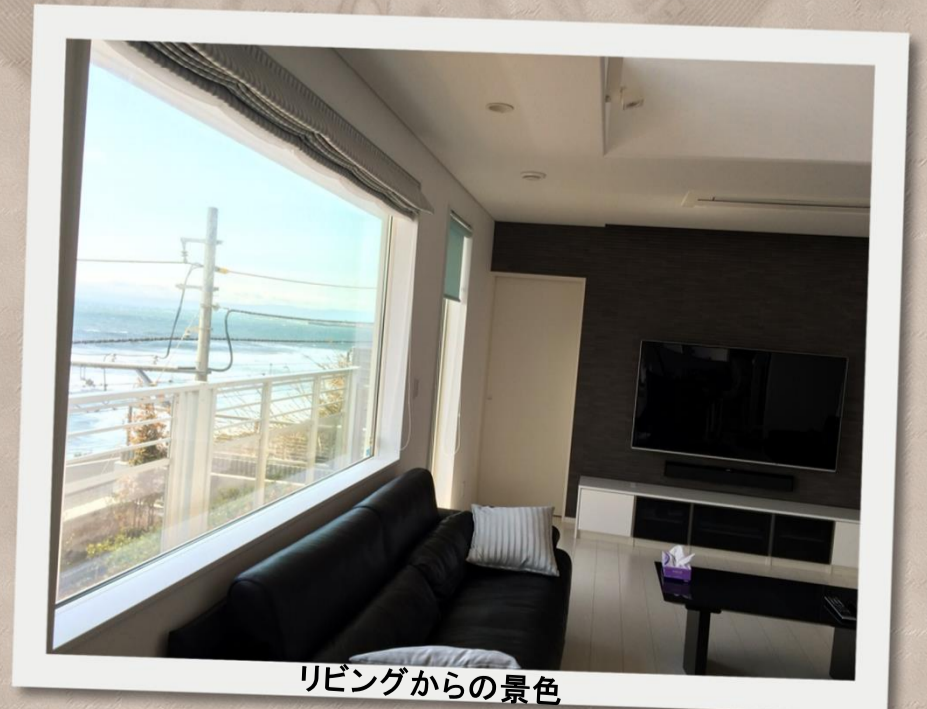
リビングからの景色