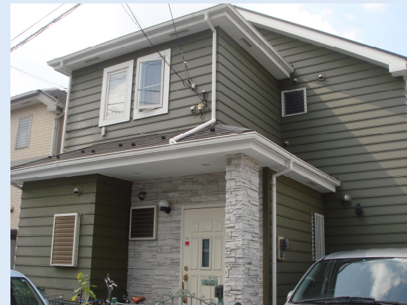
お施主 坂井様邸 建築地 町田市 建築年度 平成15年

坂井様は、建築後1年半住まわれた後、転勤になり5年前に戻られるまではお家を賃貸住宅にされていました。5年点検で気になる所だけを直されたものの、ご家族のライフスタイルが変わり、10年点検の際には屋根・外壁塗装工事がしたい、和室をフロー