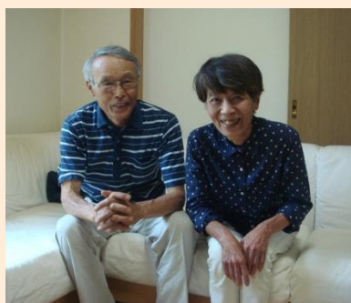
【明るいリビングのソファ】

塗装はクリアを選ばれ、新築同様の光沢を取り戻されたお住まいは、内側からだけでなく外側からのお手入れも万全で、更に長く安心して住んで頂けます。太陽光を設置され、人と環境へのやさしさがパワーアップしたお住まいで、益々お元気にお過ごし頂ける様に、これからもお手伝いをして参りたいと思っておりますのでよろしくお願い致します。