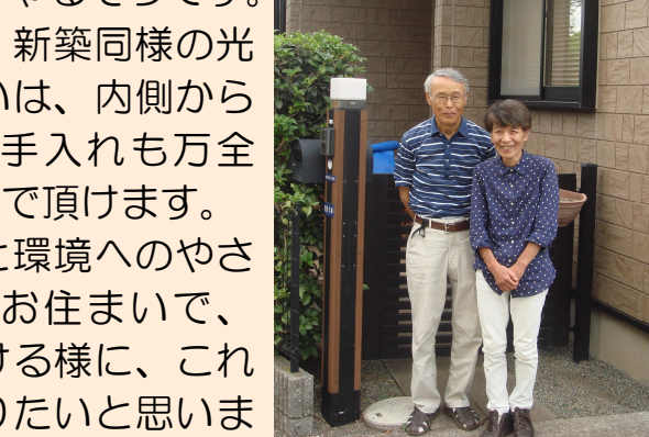
【仲睦まじいご夫妻】

電力使用量を測定し、これからのライフスタイルに合わせた節電の提案が頂けたこと、電気料金の契約内容を見直せたことが良かったとお話くださいました。今は毎月の電気料金と売電とを分けて記録し、ご夫婦で楽しんで節電に取り組んでいらっしゃるそうです。