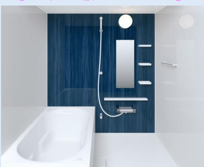
【リフォームしたバスルーム】

そこで、今までお使いの浴室で不便に感じられていたところを細かくお聞きし、改善できる商品をご提案させて頂くために実際にショールームへご案内して、展示してあるお風呂に入り、大きさや使いやすさを体感して頂きました。浴槽は保温が持続するようサーモバスにし、窓にはインプラスを付け二重窓に施工させて頂きました。また体を洗う時にシャワーの高さを上下に調節が出来るものを選びました。