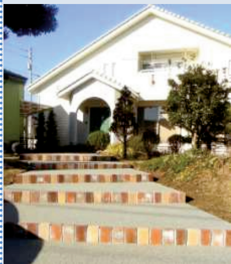
淡い緑色のリンクストーン 足元が明るくなり満足です。