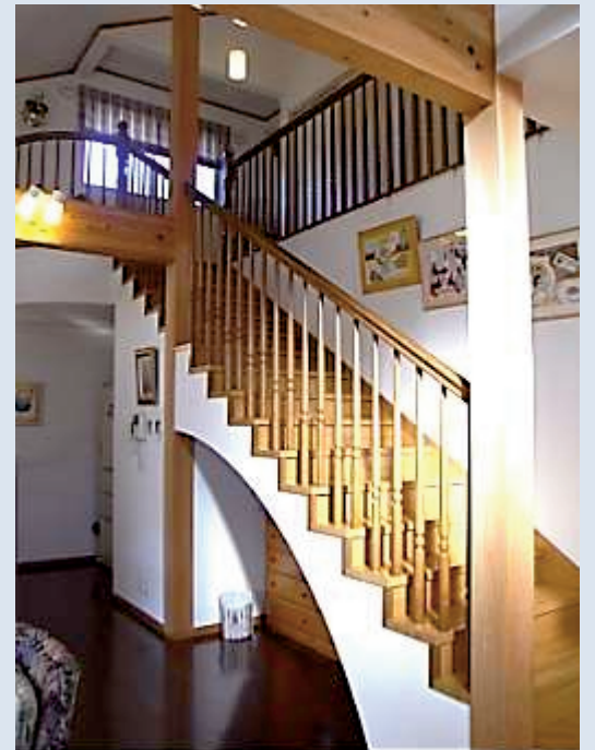
存在感たっぷりの階段は 10 年前と変わらず綺麗なままでした。