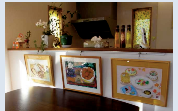
ご主人の趣味の絵画等が きれいに飾られています。