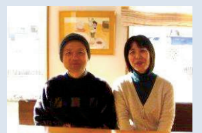
自然を大切に思い、 シンプルに暮らしている、 素敵な浅沼様ご夫婦です。