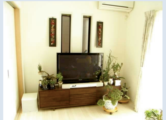
ウッドデッキにつながる明るいリビング

リビングにお邪魔させていただくと、とても明るくとにかく広々としていて、吹き抜けの解放感と白い床・白い壁の一体感がさらに広さを感じさせていました。また二部屋から出入りが可能なウッドデッキがリビングをより一層明るく広々と見せているようです。室内にいても太陽の光がたくさん入ってくるのでご家族の元気の源となっているとおっしゃっていました。