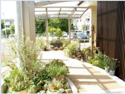
玄関につながるアプローチとグリーン

ご主人様が玄関先まで出てきて下さり、室内に上がらせて頂くと玄関がとても広く作られていて、ここにもラベンダーが飾られ素敵に演出されていました。お子様の車いすがアプローチから玄関を通してリビングまで入ってこられるような設計にしてあるそうです。玄関ホールの石目柄のハピアフロア（旧ダイハード）は、弊社のモデルハウスで体感して冷たくないこの床材を気に入ってくださり、同じものにしたいと選ばれたそうです。