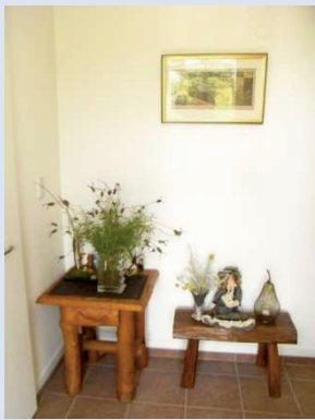
素敵に飾られた玄関

リビングにお邪魔させていただくと、とても明るくとにかく広々としていて、吹き抜けの解放感と白い床・白い壁の一体感がさらに広さを感じさせていました。また二部屋から出入りが可能なウッドデッキがリビングをより一層明るく広々と見せているようです。室内にいても太陽の光がたくさん入ってくるのでご家族の元気の源となっているとおっしゃっていました。