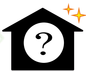
新モデルハウス 2015年9月完成(予定)