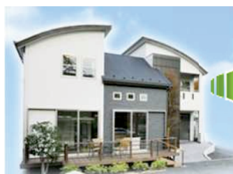
モデルハウス「パシーフ」