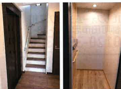
玄関入口左にゆったりとしたエレベーター

現在80歳になるお母様は、趣味の日本舞踊を踊り続けていらっしゃる、とても明るくて元気いっぱいのお母様です。I様とお母様にお話しを伺いました。