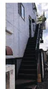
3階まで思い荷物を持ちながら登った階段