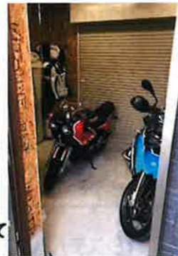
玄関側からも出入りが出来る。便利なビルトインガレージ。