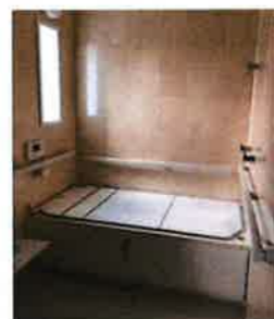
手すりが3面に付いているので安心です