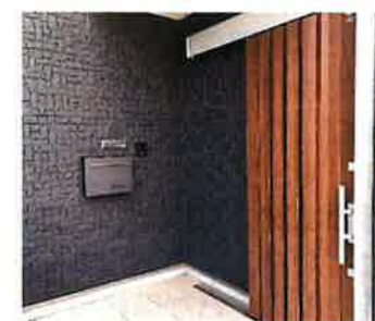
シックなモダンテイストの玄関