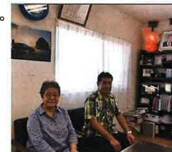
代表取締役のI様 I様のお母様。ジャビット人形のお隣は先代表でもありお父様。