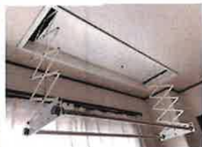
自動収納型室内物干し